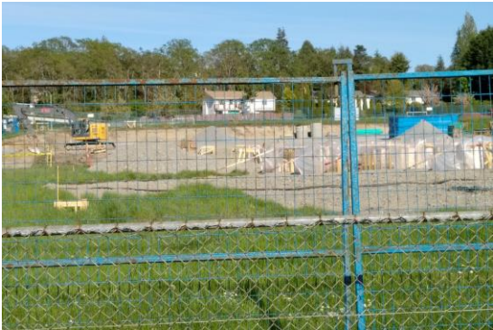
2 mai 2021