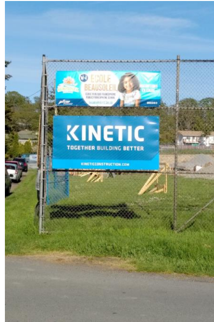
2 mai 2021