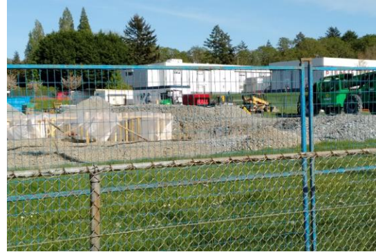
2 mai 2021