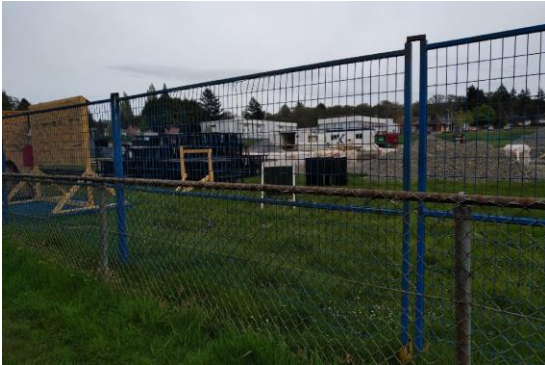
27 avril 2021