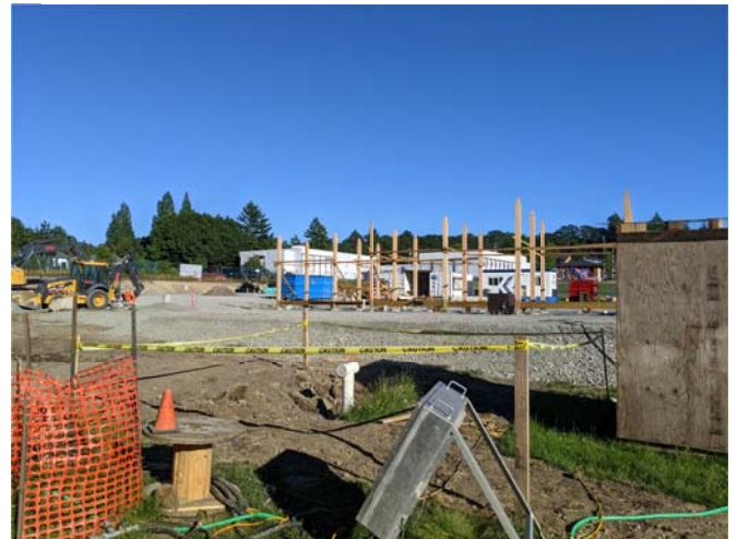
19 juin 2021