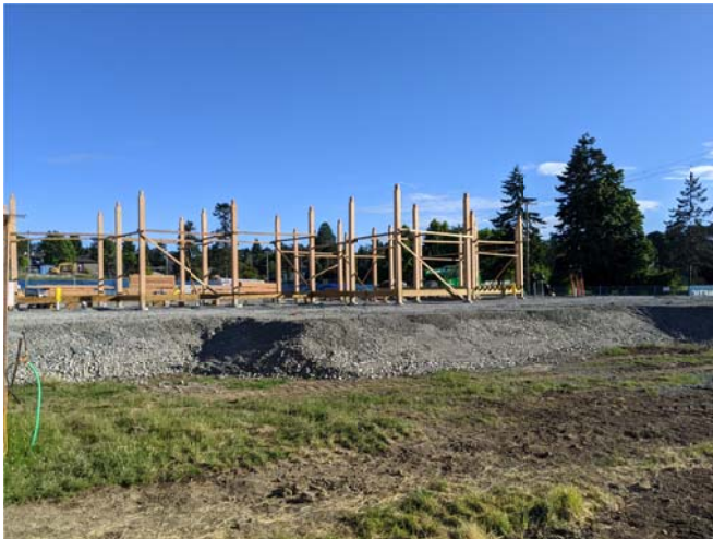
19 juin 2021